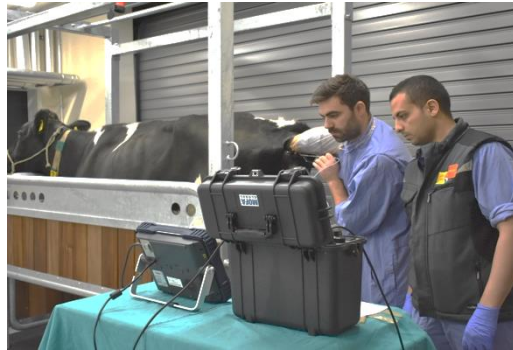
Abb. 1: Ultraschallgeleitete Follikelpunktion beim Rind