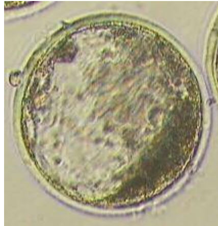
Abb. 4: Embryo nach Befruchtung und 7-tägiger Kultivierung im Labor